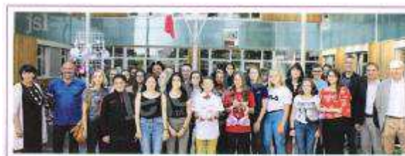
LES PARTICIPANTS À L'ACTION.